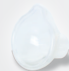
Säuglingsmaske PZN 09 467 455