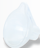
Kindermaske PZN 09 467 509