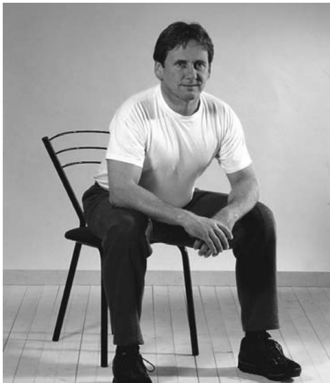
Der Kutschersitz.